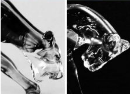
Sculptures félines en verre - Panthères en verre - Sculptures animalières réalisées au chalumeau - Rhénald Lecomte - Art Verrier