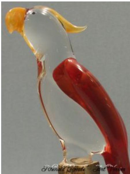
Verrerie d'art et oiseau décoratif à poser - Sculpture perroquet - Ara sculpté en verre couleur rouge - Création 2010 - Rhénald Lecomte - Art Verrier