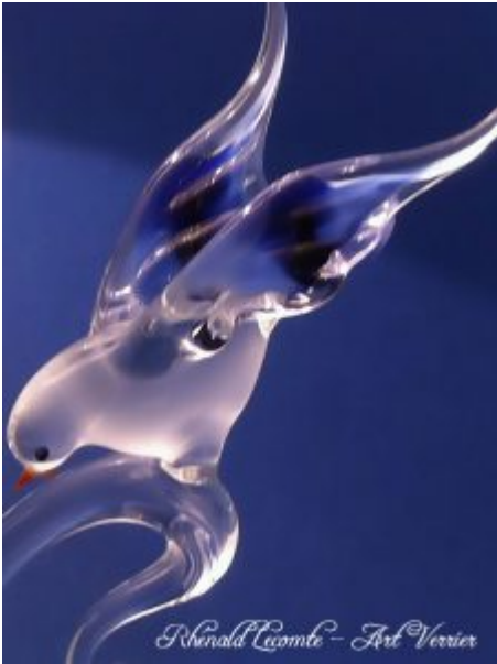
Sculpture animalière - Sculpture hirondelle en verre - Corps en verre satiné et ailes en verre bleu - Détail lumineuse d'art - Lampe hirondelles dominante couleur bleu - Création 2016 - Rhénauld Lecomte - Art Verrier