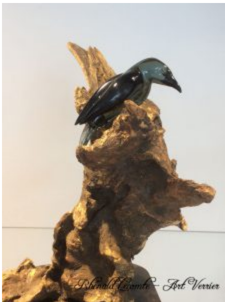
Sculpture animalière verre et bois - Corbeau en verre juché sur une pièce de bois brut - Création 2020 - Rhénauld Lecomte - Art Verrier