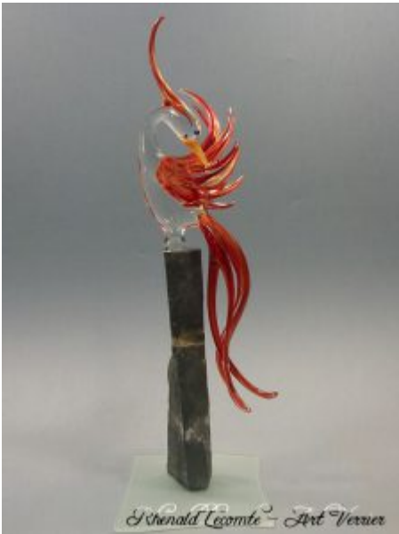
Verrerie d'art - Création animale en verre - Sculpture paradisier en verre plumage rouge sur socle pierre - Réalisation 2013 - Rhénald Lecomte - Art Verrier