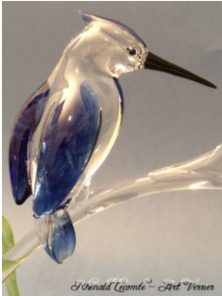
Martin pêcheur chasseur à l'affût plumage bleu - Oiseau sculpté en verre bleu et verre transparent - Création d'art animalière à poser - Création 2019 - Rhénald Lecomte - Art Verrier