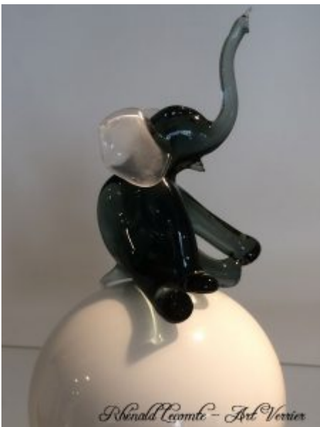
Verrerie d'art animalière - Sculpture éléphant assis en verre gris sur sphère blanche - Sphère Ø 10 cm - Hauteur 18-20 cm - Création 2020 - Rhénauld Lecomte - Sculpteur animalier