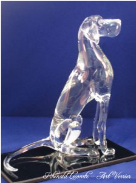
Sculpture chien en verre - Dogue allemand en verre plein façonné au chalumeau - Création 2015 - Rhénald Lecomte - Art Verrier