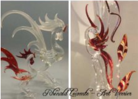
Verrerie d'art - Sculptures animalières - Oiseaux en verre sculptés au chalumeau - Rhénald Lecomte - Art Verrier