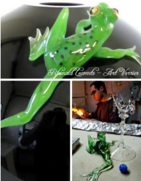
Love is all - Sculpture animalière de prestige numérotée - Grenouille verte en verre sur vase forme sphérique - 2015 - Verrier au chalumeau sous observation - Art Verrier © Jérémy Giorgio 2011