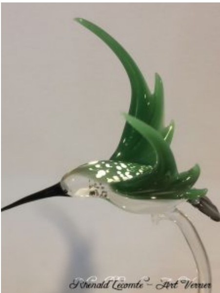
Création d'art en verre - Sculpture colibri - Colibri en quête de nectar - Vol d'approche sur une fleur d'arum en verre blanc - Création 2019 - Rhénald Lecomte - Art Verrier