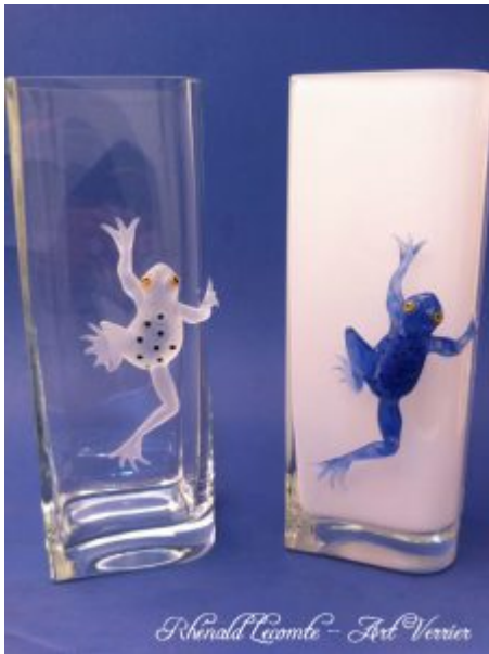
Vases décoratifs grenouille - Vases grenouilles avec batraciens en verre sculptés au chalumeau - Création 2016 - Rhénald Lecomte - Art Verrier