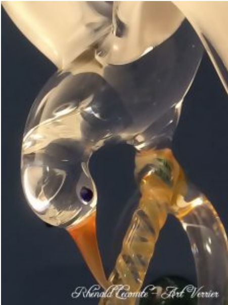
Décoration marine chic - Ancre marine sculptée au chalumeau avec deux mouettes - Plan rapproché sur mouette et bout en verre - Création 2019 - Rhénald Lecomte - Art Verrier