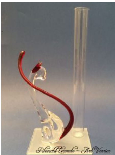
Soliflore animalier en verre - Objet d'art à poser - Vase chat en verre avec félin assis sur plaque de verre carrée - Soliflore tubulaire - Oreilles et queue en verre couleur rouge - Corps translucide - Création 2018 - Rhénald Lecomte - Art Verrier

A la recherche d'une sculpture d'animal en verre pour affirmer votre passion, enrichir votre collection ?