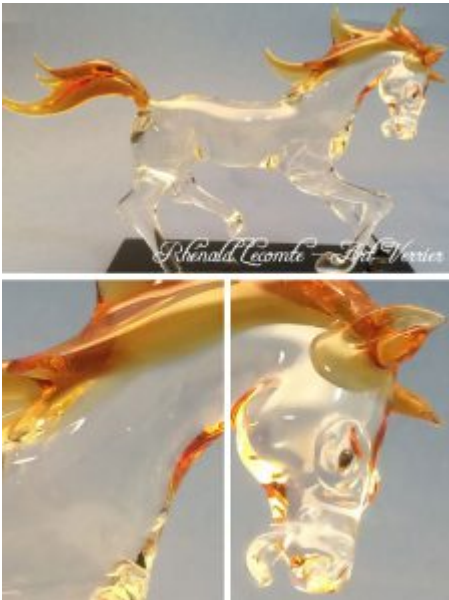
Sculpture animalière - Beauté du cheval - Cheval sculpté en mouvement - Sculpture en verre plein - Crinière et queue couleur ambre - Création 2019 - Rhénald Lecomte - Art Verrier