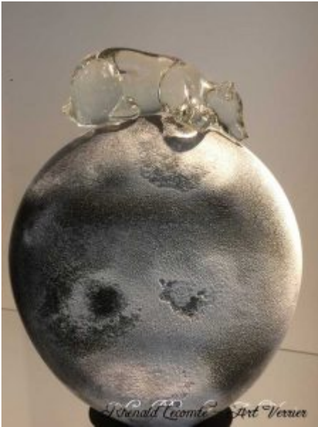
Verrerie d'art animalière - Ours endormi sur sphère en verre soufflé - Sculpture ours en verre translucide - Création 2020 - Rhénald Lecomte - Art Verrier