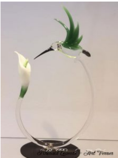
Objet d'art décoratif - Sculpture oiseau en verre - Colibri en quête de nectar - Création 2019 - Rhénald Lecomte - Art Verrier