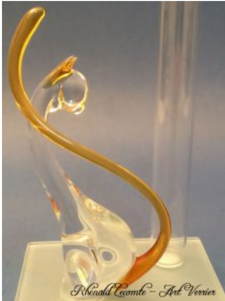
Vase animalier en verre - Soliflore chat en verre avec félin assis sur plaque de verre carrée - Soliflore tubulaire - Oreilles et queue en verre couleur ambre - Corps translucide - Création 2018